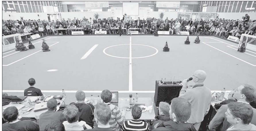
Roboter spielen nicht ferngelenkt, sondern selbständig agierend Fußball. Das Bild entstand beim RoboCup 2009 in Hannover.